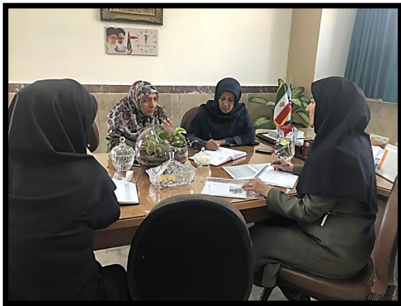
جلسه تیم آموزش با دبیران در رابطه با مسابقه جهانی فضا - تاریخ: ۹۷/۷/۱۶